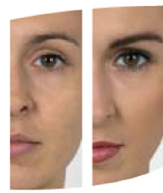
VOR DER BEHANDLUNG NACH DER BEHANDLUNG

VIS A VIS bietet ein innovatives Semipermanent Make-up, um Gesichtslinien und -farben zu betonen, nachzuzeichnen und harmonisch zu gestalten – mit einem absolut natürlichen und eleganten Ergebnis.