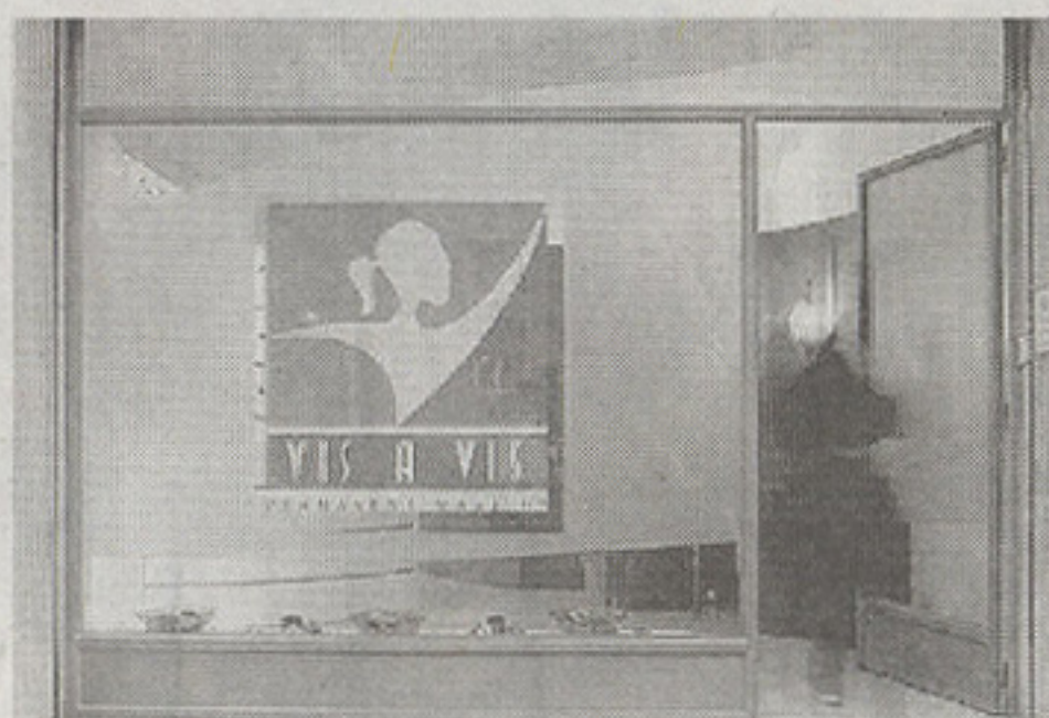
A sinistra un interno e l'esterno dell'istituto VIS A VIS di Bolzano in via Dalmazia

tecnica d'avanguardia che permette di marcare, ridisegnare e armonizzare le linee ed i colori del viso per mezzo di pigmenti fissati nel primo strato di pelle. E' dunque la soluzione estetica più immediata per correggere ed enfatizzare il colore naturale e l'originale forma delle sopracciglia, delle labbra e degli oc-